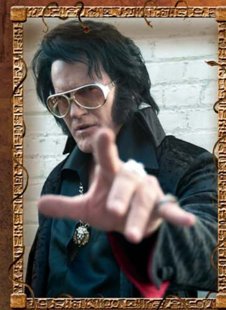
Figure emblématique du cinéma fantastique des années 80 et devenu acteur culte grâce à Evil Dead, il joue également dans Maniac Cop 1 et 2 (1988 et 1990), avant de se reconvertir à la télévision avec le rôle principal dans les séries "Les Aventures de Brisco County" en 93 (diffusé sur M6) et "Jack of all trades". Il interprète des rôles récurrents dans les séries X files, Charmed, Xena, Hercule...en parallèle avec le cinéma dans "Escape from LA", "Running Time", "Serving Sara", "The Majestic" etc...

Touche à tout Bruce passe derrière la caméra, en 2001, après avoir oeuvré en tant que réalisateur pour les séries Hercules et Xena, il continue dans la même voie et tourne Fanalysis, un documentaire sur les fans. Il vient tout juste de réaliser son premier long métrage "Man with the screaming Brain" une comédie fantastique burlesque. Il se lance aussi dans l'écriture avec son premier livre "Confessions of a B Movie Actor" succès surprise aux USA. Il réitère avec « Make Love the Bruce Campbell Way.